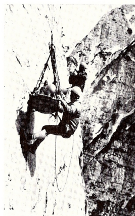
Zahtevno stensko reševanje

Velika škoda je, da ni bilo mogoče vzpostaviti telefonske zveze in da je vojak v karavli ob pozivu iz doma Iskre ponevedoma dal napačno informacijo, češ da žičnica obratuje.