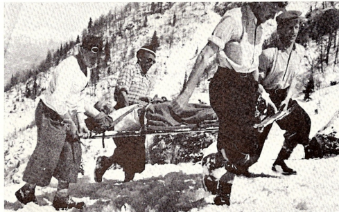
Z enega prvih reševalnih tečajev pred vojno

Kljub razvitemu alpinizmu, planinstvu in smučanju v Tržiču, je bilo članstvo v GRS omejeno. V severni steni Storžiča so gradili bivak. Gonilne sile gradnje so bili prav alpinisti — gorski reševalci. Leta 1948 so se tržički reševalci udeležili zbora gorskih reševalcev na Vršiču. »Kot najboljšemu moštvu nam je Centrala dala priznanje