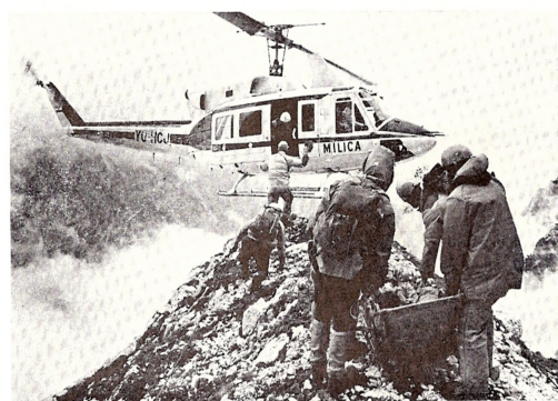
in leta 1986 v triglavski steni