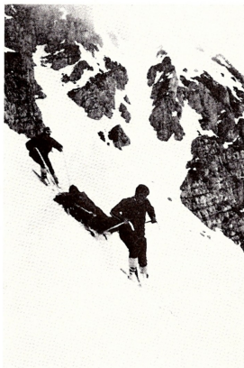
Prevoz ponesrečenca z akia čolnom

Kdor je kdaj občudoval mogočnost narave, ko je Begunjščica stresala silne snežne gmote s svojih nederij, kdor je kdaj po viharni noči zarezal prvo jutranjo smučino v deviško zglajeno belino zeleniškega plazu, kdor je le enkrat poslušal pripovedi Tinčka in Zavrotarja v zimskem večeru na Zelenici, ta se bo le težka uprl notranji sili, da se znova in znova ne bi vračal semkaj. Tudi za desetino tržiških gorskih reševalcev to velja, ki že tam od leta 1964, ko se je prvič zavrtelo vreteno zeleniške žičnice, skrbje za varnost tamkajšnjih smučičev.